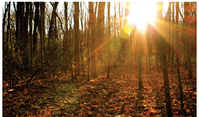
Après-midi d'automne dans la forêt McGill

Un autre projet majeur qui bénéficiera grandement à Senneville est la construction cet hiver d'un nouveau complexe industriel sur le site de 15,6 acres du côté nord de l'autoroute transcanadienne que Senneville a obtenu