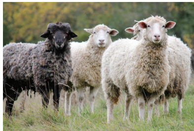
Évidemment Ralph est le mouton noir.

Paysage : La portion du Chemin Senneville entre l'autoroute 40 et la frontière de Pierrefonds a été désignée par le statut fédéral comme étant un Lieu historique national du Canada. De façon officielle, ce statut est lié aux célèbres propriétés luxueuses dessinées par des architectes de renom. Ces structures sont complémentées par la nature sinueuse du chemin, le paysage rural des bâtiments agricoles, et surtout la vieille camionnette Fargo.